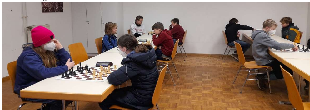
Bilder der 4ten und letzten Runde

Leider fielen bei Waldkirch kurzfristig zwei Kinder aus, so dass am Samstag nur zwei Vereine antraten. Wir konnten kurzfristig noch zwei Spieler motivieren, so dass die Bezirksjugendmannschaftsmeisterschaft u14 mit 3 Teams ausgerichtet werden konnte. Die SJB hat in diesem Jahr beschlossen hat, die Qualifikation zur Badischen als Online-Vorrunde durchzuführen, sodass dieses Turnier keine Qualifikation war, die Kinder haben sich aber doch gefreut ein Präsenztturnier mitzuspielen. Alle Kinder konnten einen Preis mit nach Hause nehmen. Im Gegensatz zu u12 siegte diesmal der ausrichtende Verein vor der Schachwerkstatt Eichstetten und dem 2ten Teams der FSF1887 Zähringen.